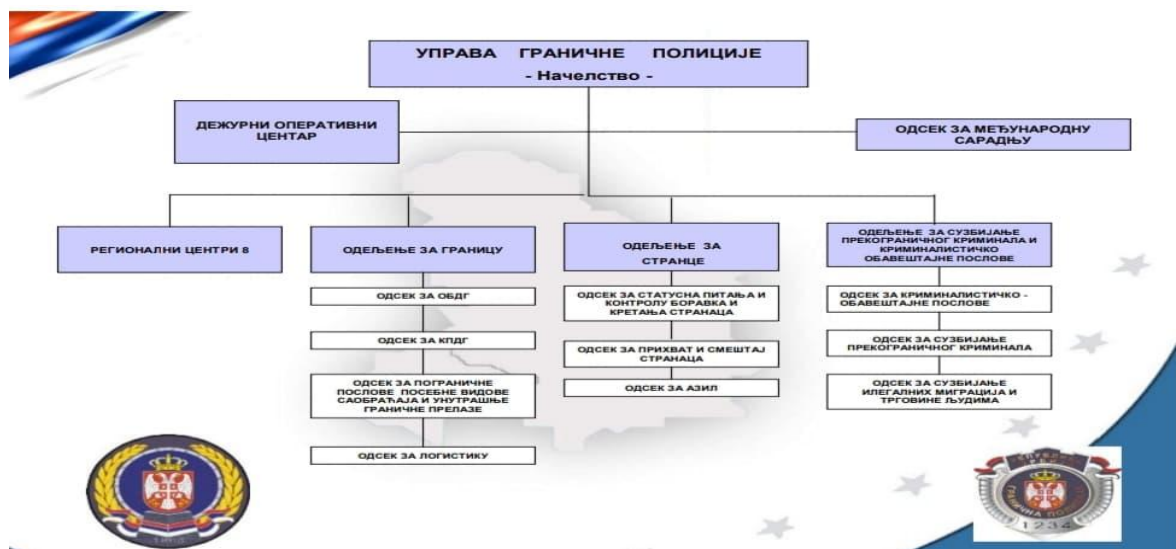
Шема 1: Организација Управе граничне полиције на централном нивоу

На централном нивоу, своју функцију остварује преко Одељења за границу , Одељења за странце , Одељења за сузбијање прекограничног криминала и криминалистичко-обавештајних послова , Одељење за развој система интегрисаног управљања границом и Дежурног оперативног центра . 16