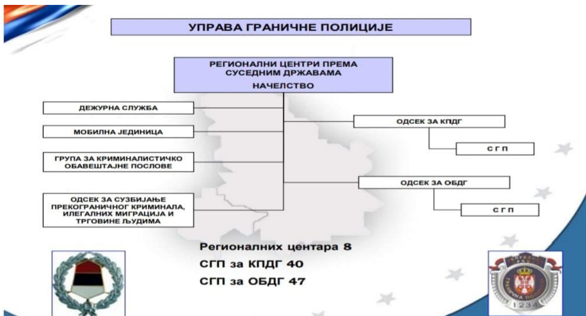
Шема 2: Организација Управе граничне полиције на регионалном нивоу

На регионалном нивоу Управа граничне полиције је организована да остварује функцију преко регионалних центара граничне полиције , који су формиран територијално, тако да сваки од њих има надлежност над делом државне границе према једној суседној држави, осим према Румунији где постоје два регионална центра, један северно од реке Дунав, а други јужно. Организација регионалних центара је у принципу слична, а разлике које постоје су настале услед специфичности територије коју покривају и државе према којој су усмерени. У оквиру центра налазе се Одсек за обезбеђење државне границе, Одсек за контролу прелажења државне границе, Одсек за сузбијање прекограничног криминалитета, Група за криминалистичко обавештајне послове, мобилне јединице и дежурне службе.