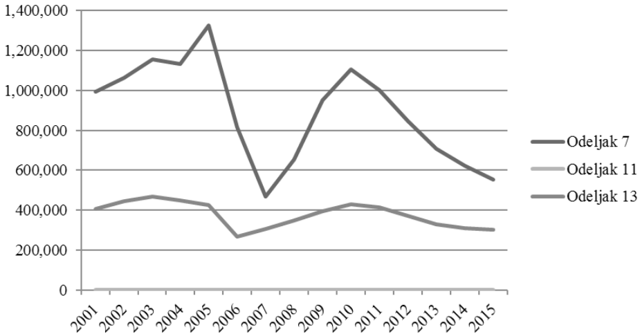
График 2. Хронолошки приказ броја отворених стечајних поступака појединца у САД према облику поступка